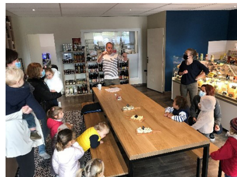
Une matinée riche en saveurs pour petits et grands !

Enfin, la boulangerie nous avait préparé des chouquettes très appréciées des enfants !