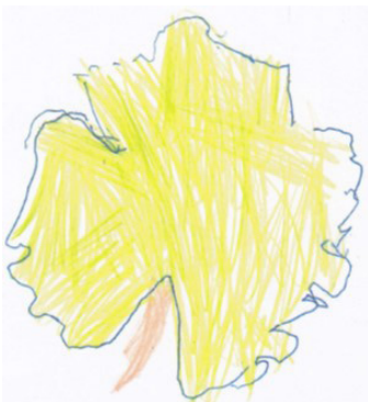
Feuille de vigne dessinée par Albane

Ils ont dessiné une feuille de vigne choisie et l'ont coloriée, la palette de couleurs allant du vert foncé au rouge vif, en passant par le jaune.