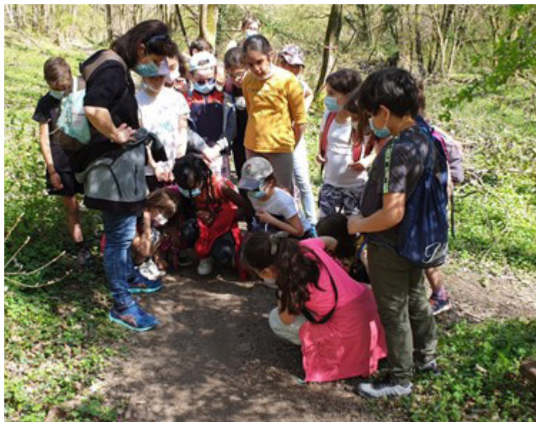
Les élèves de CE2 de l'école des Landes

Le mardi après-midi, avec toute notre classe de CE2 de l'école des Landes, nous partons en randonnée sur les chemins ou dans les bois de Montagny.